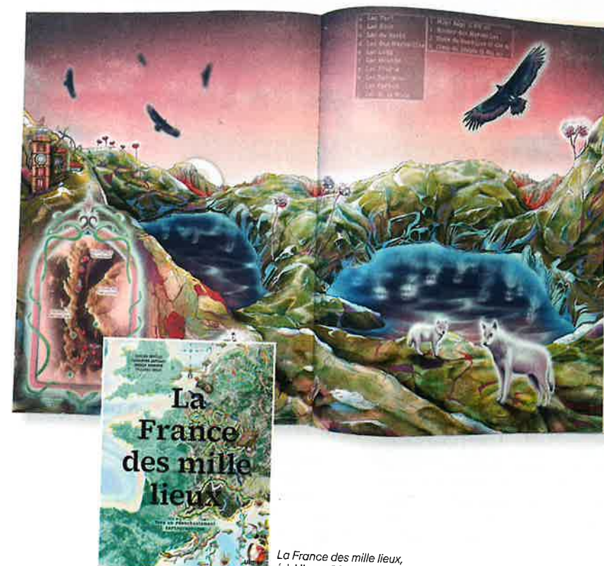
La France des mille lieux , éd. Ulmer, 38 €.

C'est un beau livre dédié à la France, qui s'attache à raviver la géographie culturelle, discipline qui souligne le lien profond entre les êtres humains et les lieux où ils habitent, le sens qu'ils donnent, chez eux, aux reliefs, aux cours d'eau, aux forêts, aux saisons... Ce «réenchantement cartographique», qui s'appuie sur de jolies illustrations, explore, entre autres, les promenades fleuries des peintres, entre Eure et Creuse ; la grotte Cosquer, joyau de l'humanité dans la calanque de la Triperie, à Marseille, une «bibliothèque rocheuse» qui s'effrite peu à peu dans la mer ; le bocage du Bas-Berry, pays de chênes et de châtaignes, long couloir reliant Nevers à Châteauroux, aux douces rivières et aux villages discrets ; mais encore le patchwork forestier du Pays basque, qui épouse les différents chapitres de l'histoire française, les transhumances, les légendes, l'épopée minière. À rebours de la mondialisation standardisée et de l'uniformisation des modes de vie, il incite à mieux regarder les mille détails qui font que chaque paysage est aussi unique que précieux.