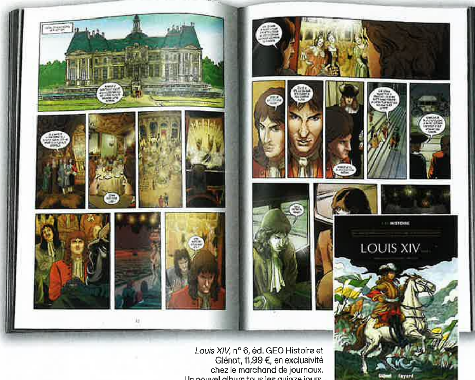
Louis XIV , n° 6, éd. GEO Histoire et Glénat, 11,99 €, en exclusivité chez le marchand de journaux. Un nouvel album tous les quinze jours.

Ce sixième volume de la collection Les Grands Personnages de l'histoire en BD retrace les étapes de la vie de Louis XIV, de son enfance – il monta sur le trône à 5 ans – marquée par les troubles de la Fronde jusqu'à l'affirmation de son autorité absolue. Une attention particulière est portée à Versailles, dont la construction accompagna la montée en puissance du monarque. Le château devint à la fois résidence royale, théâtre du pouvoir et vitrine du rayonnement français. Un dossier signé de l'historien Hervé Drévilhon complète la bande dessinée. Illustré de documents d'archives, il éclaire le contexte du XVII e siècle et analyse les transformations politiques, militaires et culturelles de cette période qui façonna la France moderne.