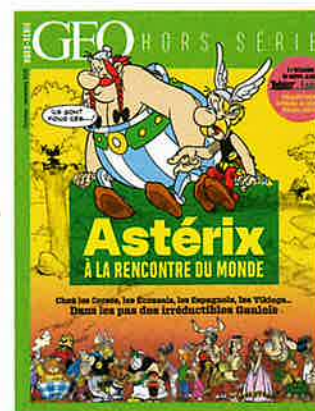
Astérix à la rencontre du monde , GEO Hors-série, 8,90 €.

Des obscurantistes belliqueux, nos ancêtres du Moyen Âge ? Attention, cliché ! Littérature, architecture, médecine... GEO Histoire vous emmène dans une époque empreinte de curiosité intellectuelle, d'innovation technique et d'ouverture sur le monde. À retrouver aussi dans ce numéro : le récit fictionnel d'un maître ninja de l'époque d'Edo et un reportage en Ukraine où sont restées miraculeusement debout des églises de bois, édifiées il y a des siècles. Bonne lecture !