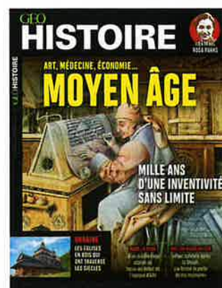
Le Moyen Âge, mille ans d'une inventivité sans limite , GEO Histoire, 7,50 €.