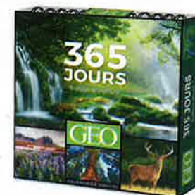
Sublime nature : 365 jours , éd. Playbac, en librairie, 15,95 €.

De l'antique voie lycienne devenue sentier de randonnée en Turquie, au cirque de Mafate à La Réunion, en passant par Bhigwan et ses flamants roses, en Inde, et les dunes de Sossusvlei, en Namibie, ce calendrier perpétuel offre chaque jour des photos de paysages grandioses autour du monde, accompagnées d'un texte ou d'une citation qui appelle au voyage et à l'évasion. Un cadeau de fin d'année toujours très apprécié.