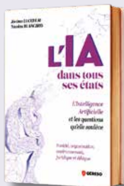
● L'IA dans tous ses états par Jérôme Lucereau et Nicolas Blanchon Éditions GERESO, 280 pages - 28 €