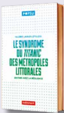
● Le syndrome du Titanic des métropoles littorales par Valérie-Lavaud-Letilleul Collection Les cahiers POPSU, 114 pages - 10,50 €